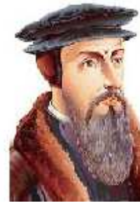
Figura 10: Juan Calvino

El francés Juan Calvino, marcó el destino de la Iglesia protestante desarrollada en Suiza e inició la reforma al cuestionar públicamente el desempeño de la Iglesia Católica. Su propuesta fundamental fue la Predestinación, la cual consistía en que todos los hombres traían desde el momento de su nacimiento el destino de su salvación dictado por Dios. Sin embargo, nadie estaba enterado de la condición que gozaba y por ello se debían hacer buenas acciones y poner el máximo esfuerzo en hacer las cosas bien, pues una muestra de la protección divina y su salvación era la evidencia material de la prosperidad económica. Estos principios calvinistas fueron la antesala del capitalismo posterior. Los calvinistas son conocidos en Francia como hugonotes y puritanos en Inglaterra y Escocia.