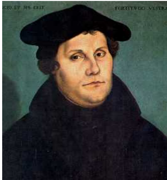
Figura 9: Martin Lutero

El alemán Martín Lutero , agobiado por la cuestión de la salvación espiritual de los hombres, inició la lectura sistemática de las sagradas escrituras y encontró en ellas la solución ante semejante agobio. Consideró que el perdón de los hombres solo podía ser alcanzado mediante la fe; y no por mediación de los clérigos católicos que no solo vendían el perdón a través de las indulgencias, sino que además amedrentaban a los fieles amenazando cerrar iglesias o excomulgándolos. Así, proponía que la salvación se alcanzaba solo a través de la fe y no por medio de las buenas obras.