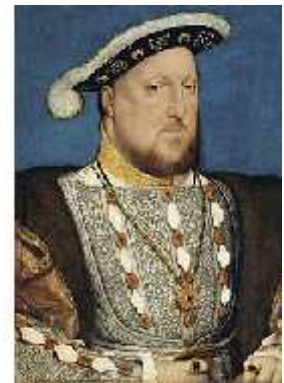
Figura 11: Enrique VIII

Este hecho quebró las relaciones con el Papado, Enrique VIII fue excomulgado, y éste en respuesta fundó una nueva Iglesia, expropió todos los bienes del clero e Iglesia católica, persiguió a los fieles y mandó a decapitar a su Canciller Tomás Moro quien se manifestó a favor del Papado romano.