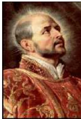
Figura 12: San Ignacio de Loyola (1491-1556), fundador de la Compañía de Jesús.