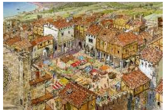
Figura 13: Representación del mercado en las ciudades de la Edad Media

Amparados en el desarrollo comercial y el resurgimiento de las ciudades, los mercaderes y artesanos tuvieron una consolidación dentro del nuevo orden social. Este nuevo grupo basó su poder en el dinero y apoyo que le brindaba la monarquía, en detrimento de los señores feudales. Sin embargo, a pesar de su riqueza, debido al sistema estamental no eran beneficiarios de privilegios nobles.