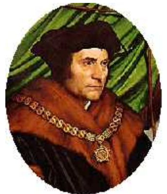
Figura 5: Tomas Moro.

Hacia el siglo XV, la caída de Constantinopla en manos de los turcos otomanos y con ello la difusión de la cultura Bizantina en latín y griego, la invención de la Imprenta y el financiamiento de intelectuales y artistas por parte de los Mecenas, ayudó a consolidar el Humanismo en Europa. Una de las obras más importantes de esa época fue Utopía del inglés Tomas Moro, quien presentó una sociedad sin propiedad privada ni estamentos sociales, en la que todo el mundo era feliz. Sin embargo al final de su obra señalaba que era algo imposible. En tanto que en Holanda Erasmo de Rotterdam publica el Elogio de la locura, una obra que buscó reformar los vicios de la Iglesia Católica y llamó a sus fieles a cuestionar las malas prácticas leyendo por sí mismos las sagradas escrituras. Erasmo fue un fiel propulsor de la idea de reformar la Iglesia Católica desde dentro, criticando duramente a Lutero.