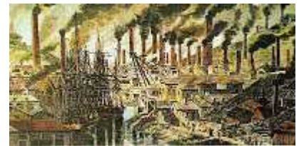
Figura 3: El impacto de la Revolución Industrial.

Las relaciones comerciales también sufrieron cambios ya que se empezó a gestar el Capitalismo Comercial, se desarrollaron las bolsas de comercio, tomó peso la moneda como sistema de cambio y los bancos como custodios de ésta. Las doctrinas económicas que se desarrollaron en este tiempo fueron: el Mercantilismo, Fisiocratismo y el Liberalismo. Además, se sentaron las bases de división laboral que fueron una causa en Inglaterra de la Primera Revolución Industrial.