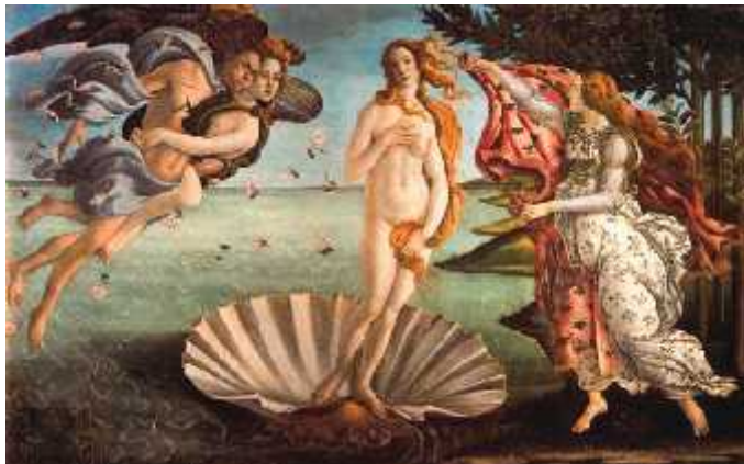
Figura 7: “El nacimiento de Venus” de Botticelli.

Fue un área de gran avance pues hasta este período no habían sido estudiadas algunas técnicas de color y de pintura ni se había descubierto como dibujar con diferentes profundidades y dimensiones, por lo que hubo gran libertad para desarrollar la creatividad. Las temáticas de preferencia fueron el retratar la perfección del cuerpo humano y representar escenas con perspectiva dando idea de profundidad y mayor realismo en las obras. Destacó el trabajo de los expositores de la escuela de Florencia con: Sandro Botticelli y sus obras “Nacimiento de Venus” y la “Primavera”, además de Leonardo da Vinci, Miguel Ángel, Rafael, Tiziano y Sanzio con la “Escuela de Atenas” y las “Madonnas”.