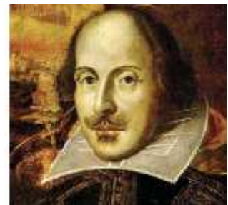
Figura 6: William Shakespeare

En otras zonas de Europa también se destacaron intelectuales cuyas obras se proyectaron hasta la posteridad; tal fue el caso de William Shakespeare (1564 – 1616), un dramaturgo inglés, creador de obras teatrales como: “Hamlet”, “Otelo”, “Romeo y Julieta”, “El Mercader de Venecia”, “Macbeth”, entre otras. Por otro lado, en España destacaron de forma especial Miguel de Cervantes con “El Ingenioso Hidalgo don Quijote de la Mancha”; Lope de Vega, dramaturgo que escribió “Fuenteovejuna”; Tirso de Molina, autor de “El Burlador de Sevilla y el convidado de piedra”; Calderón de la Barca con su obra “La vida es sueño”, entre otros.