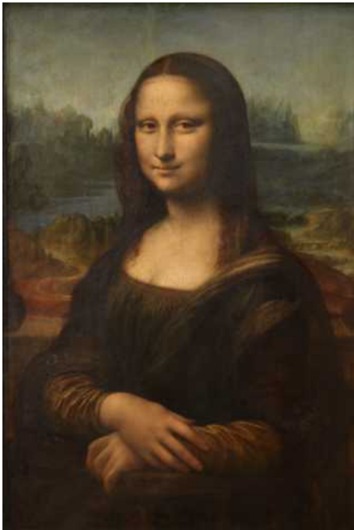
Figura 1: La Gioconda – Leonardo da Vinci (1452 – 1519)