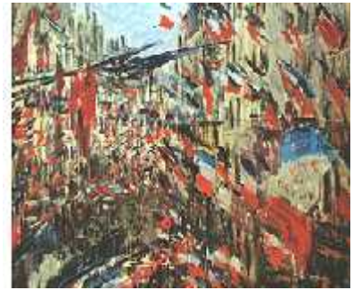
Figura 2: Representación de los estados nacionales mediante banderas.

Los siglos XVI y XVII compartieron ciertos elementos tales como la conformación de los Estados Nacionales. El siglo XVIII, por otro lado, fue un siglo de cambio de mentalidad: se cuestionó la relación divinizada que se tenía hasta entonces de los reyes, originándose dos fenómenos contrapuestos: uno exaltó aún más la imagen del rey para centralizar en él todo el poder de la Corona, denominado Absolutismo (en manos del Despotismo Ilustrado) y el otro postuló una alternativa más democrática de la autoridad, la Monarquía Constitucional.